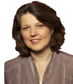
Ute Vogt, MdB Stellvertretende Vorsitzende der SPD-Bundestagsfraktion

Spontankäufe oder so „nebenbei mitnehmen“ eines Lebewesens wird dieser verantwortungsvollen Entscheidung nicht gerecht, ist aber in Bau- und Gartenmärkten, ähnlich wie auf gewerblichen Tierbörsen, sicher weitaus häufiger der Fall als beim Kauf mit ausreichender Beratung im spezialisierten Fachgeschäft.“