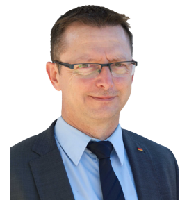
Dieter Stier, MdB Mitglied im Ausschuss für Ernährung und Landwirtschaft