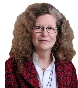
Birgit Menz, MdB Mitglied im Ausschuss für Umwelt, Naturschutz, Bau und Reaktorsicherheit